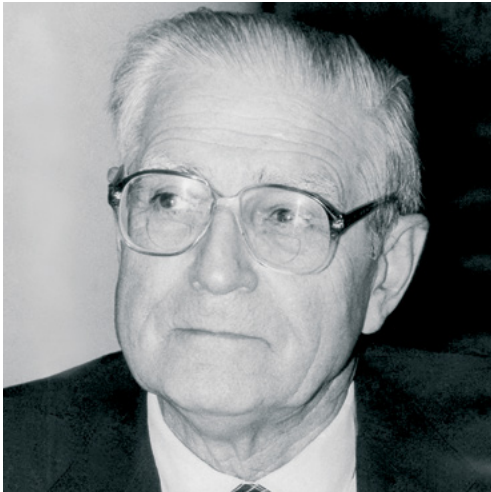
Prof. Aleksander Gieysztor (1916-1999)

Patron Nagrody prof. Aleksander Gieysztor, mediewista, jedna z najwybitniejszych postaci polskiej nauki II poł. XX wieku. Był prezesem Polskiej Akademii Nauk, członkiem Rady Fundacji Citi Handlowy im. Leopolda Kronenberga, wybitnym polskim humanistą o międzynarodowej sławie, człowiekiem zasłużonym dla kultury polskiej.